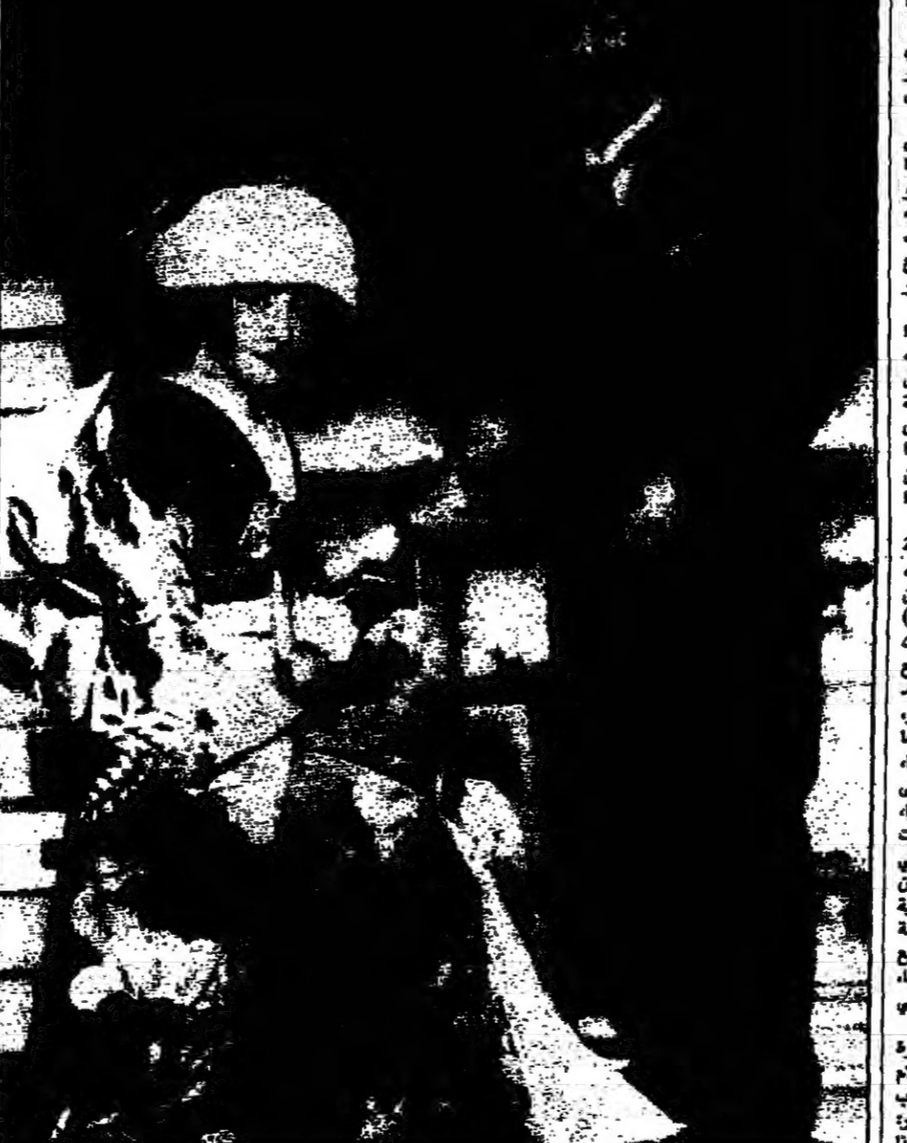
من فيلم «دايميو» لكايا كيراساوا (1965)